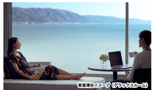
客室滞在イメージ (デラックスルーム)

最大1,500円OFF → 5,500～10,000円 (一般料金10,918～25,804円相当)