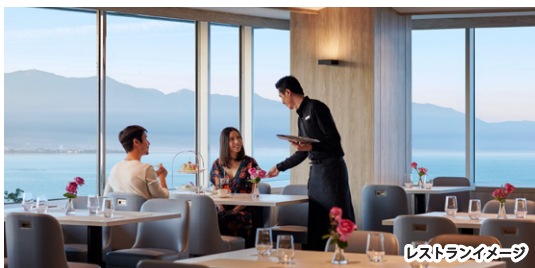
レストランイメージ