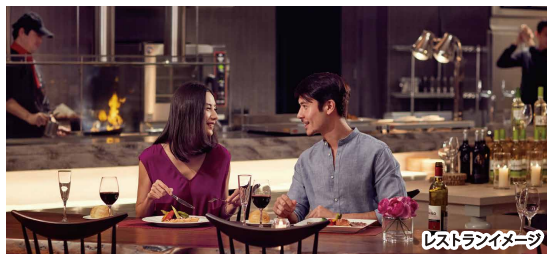
レストランイメージ