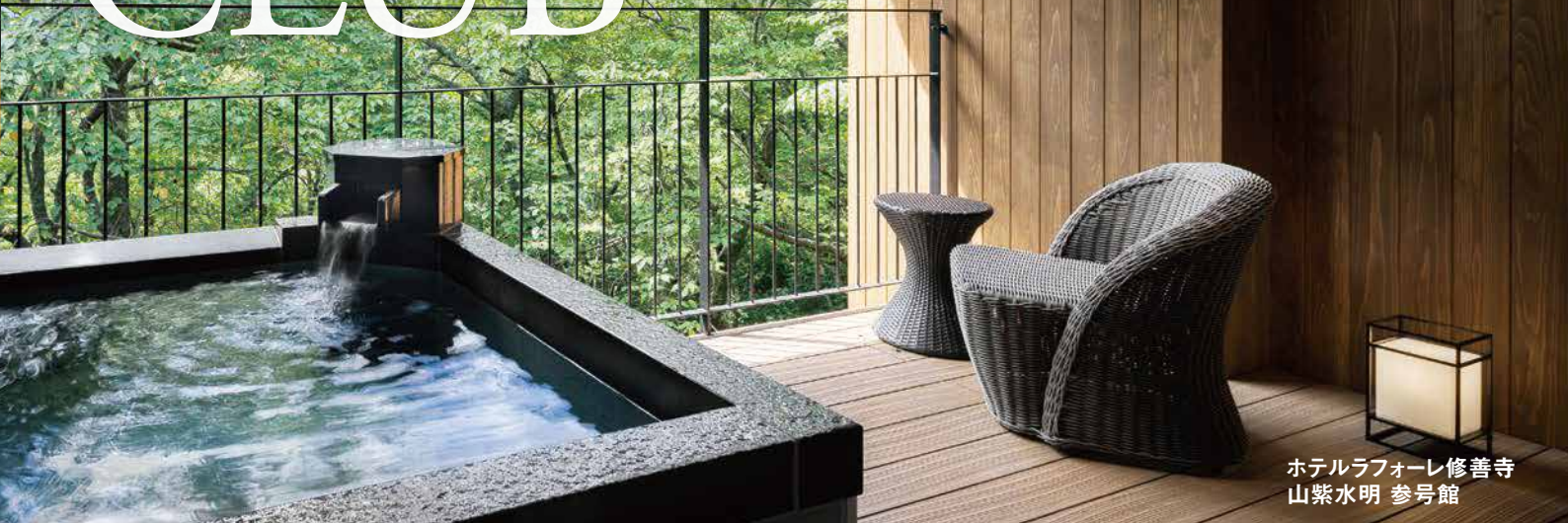
ホテルラフォーレ修善寺 山紫水明 参考館